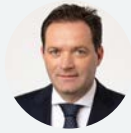
NORBERT TOTSCHNIG BUNDESMINISTER FÜR LAND- UND FORSTWIRTSCHAFT, REGIONEN UND WASSERWIRTSCHAFT