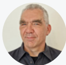
BEAT MARENDING LEITER WARENBE- SCHAFFUNG, MIGROS ONLINE