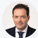
NORBERT TOTSCHNIG BUNDESMINISTER FÜR LAND- UND FORSTWIRTSCHAFT, REGIONEN UND TOURISMUS