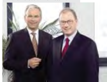
Hofer-Chefs Burger und Dold