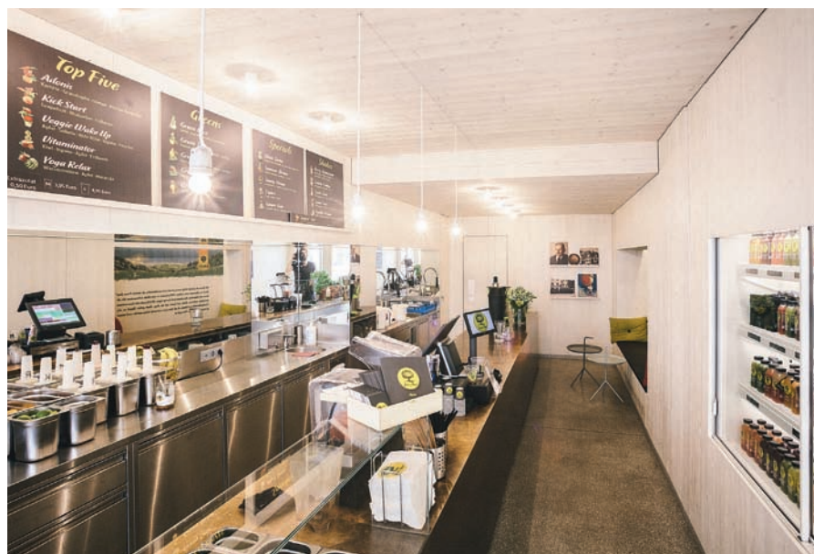
Rauch Juicy Bar in der Wiener Herrengasse ist bereits der dritte Standort

Sorte Happy Day „Multi-frucht – Tropical“. Dabei verzichtet Happy Day Sirup natürlich wieder gänzlich auf Konservierungsstoffe und Geschmacksverstärker und überzeugt mit 25 Prozent Fruchtgehalt. Die beliebte Sirup-Flasche mit dem praktischen Anti-Tropf-Verschluss präsentiert sich zudem im optimierten Design. Die im Vorjahr gelaunchte Rauch Karaffe hat sich mit den Top-Sellern Orange und Blutorange etabliert. Mit weiteren Neuheiten pusht Rauch den Markt für gekühlte Säfte. Für Rauch Eistee hat das Unternehmen speziell die Jugendlichen im Visier. Das Eisteeregal wird mit einem neuen, coolen Design und unterschiedlichen witzigen Sprüchen aufgewirbelt. Daneben kommt die impactstarke 1 Liter PET-Flasche für Eistee Pfirsich und Zitrone. Als dritten Streich für den Eistee-Markt geht heuer die Limited Sommeredition Eistee Melone ins Rennen. Die Erfolgsmarke Yippy belebt Rauch ab April